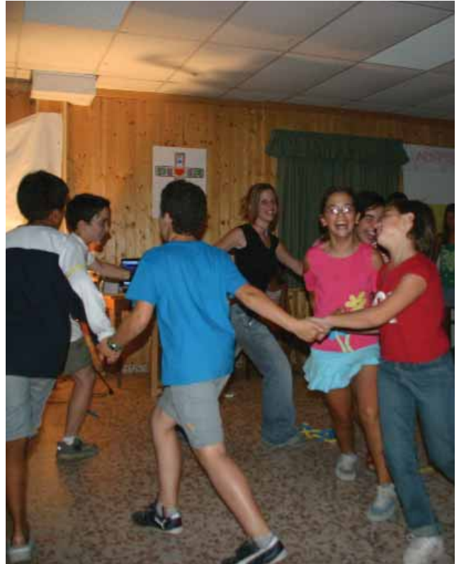
Celebramos juntos la alegría de sentirnos perdonados